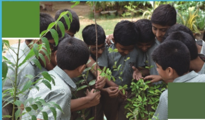
Grow Green Pakistan