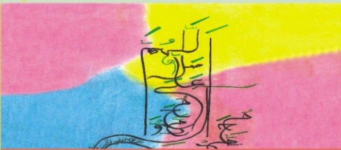
Tahama (VIII C)