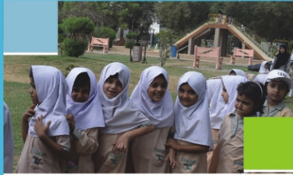
A Trip to Safari Park