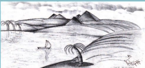
Zakir Hussain (VIII A)