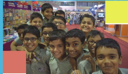
Boys enjoying at Book Fair