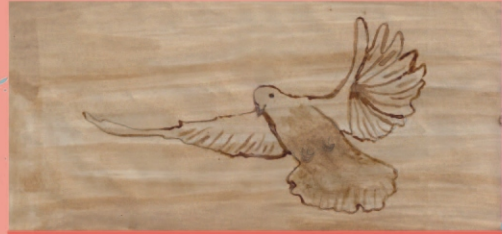
Raza Abbas (VII A)