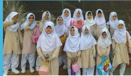
A Trip to Zoological Garden