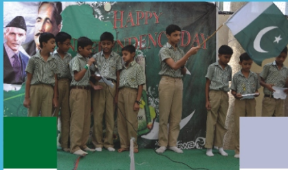
14 th August Celebration