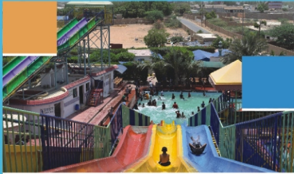
Annual Picnic 2015