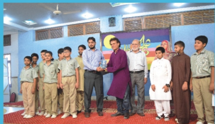
1 st Position Inter school Tableau

Intelligence plus character is the goal of true education.