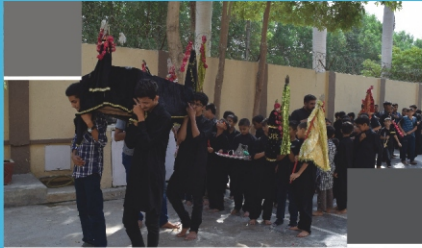
7 th Muharram ul Haram