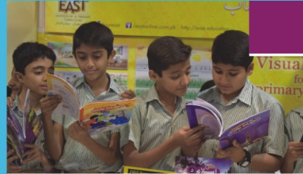
Visit to Book Fair